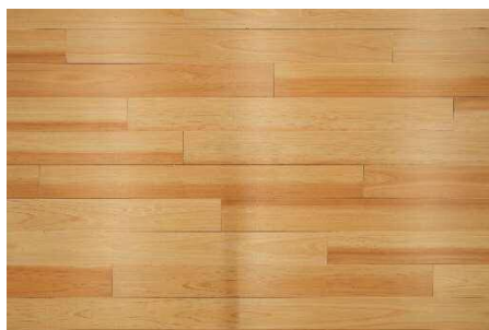
コミュニケーションタフ (スギ)